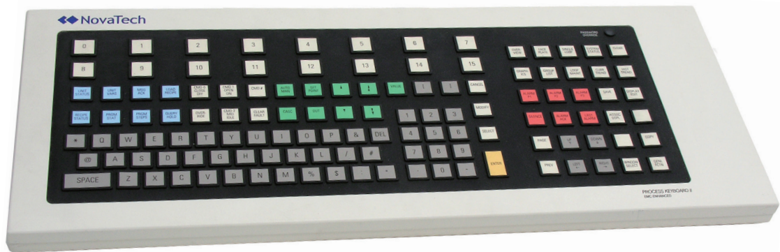
D/3 USB 键盘