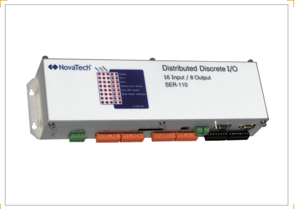
16 输入/8 输出分布式离散 I/O 模块、面板或 DIN 导轨安装

DDIO 还在附带的包中提供高分辨率 (1ms) 的时间戳、IRIG-B 端口和独立的输入电路。